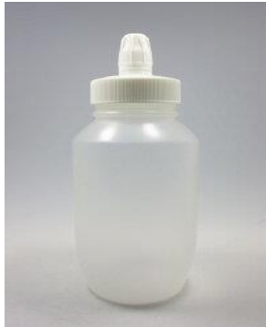
商品のイメージ写真